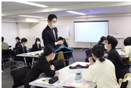
【県内大学生就職支援事業（兵庫県）】 （業界比較セミナー、意見交換会）

県内企業へのUターン就職の促進ならびに中小企業による人材確保の取組みを支援するため、自治体や県内の中小企業と連携して、大学生等を対象としたインターンシップ（就業体験）、企業見学会、業界比較セミナーをそれぞれ実施しました。