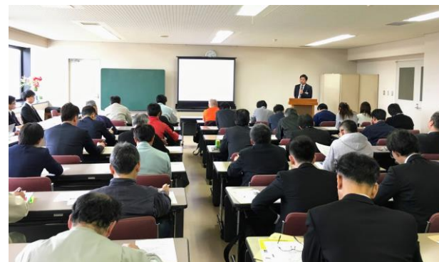
【中小企業支援セミナー（豊岡市）】

兵庫県や兵庫労働局、地元自治体等の実施する中小企業向け支援施策の周知や活用促進を図るため、豊岡市、養父市、朝来市、香美町、新温泉町、丹波篠山市、西脇市、明石市、小野市、加古川市、姫路市の11市町において、各地の自治体や商工会等と連携し、「中小企業支援セミナー」を開催しました。