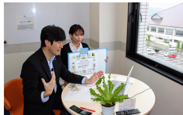
【兵庫北部オンライン企業面接会】

コロナ禍で移動が制限されるなか、地域企業の紹介や事業内容を学生に伝える機会を設けるため、Web会議システムを使用した企業合同での学生向け面接会を行政と連携して開催しました。