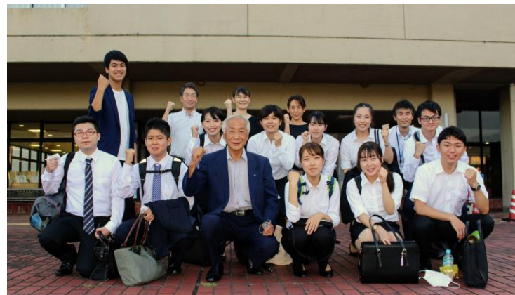
【養父市インターンシップ2020】

県内企業へのUターン就職の促進ならびに地域企業による人材確保の取組みを支援するため、行政や県内企業と連携して、大学生等を対象としたインターンシップ（就業体験）、企業見学会、企業担当者との意見交換会をそれぞれ実施しました。