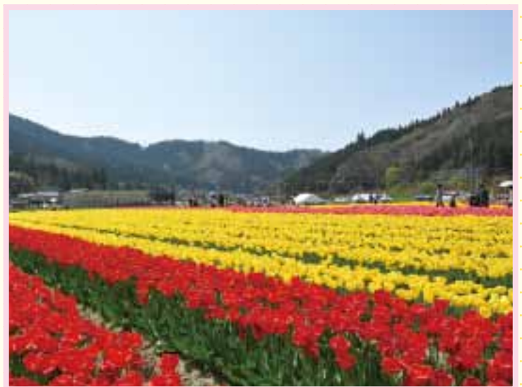
たんとうチューリップまつり