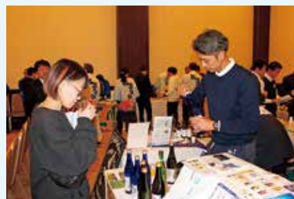
兵庫県食材提案会の様子