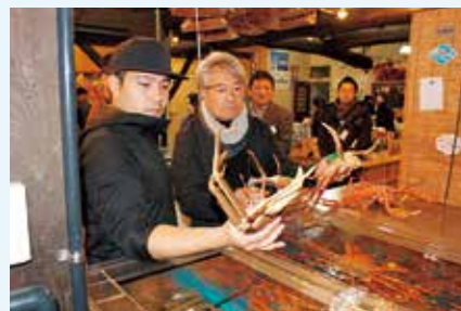
産地視察ツアーの様子

また、「兵庫県食材提案会」を開催し、食品バイヤーと生産者による商談会を実施しました。