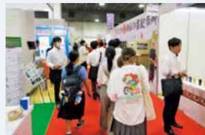
たんぎん産業メッセ2023の様子

今年度は、神戸国際展示場での展示商談会を9月に実施し、取引先企業9社が参加しました。