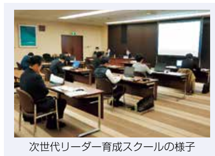
次世代リーダー育成スクールの様子

経営スキルの向上や経営者としての心構えの醸成等を図るプログラムの提供を通じて、将来地域を牽引する企業経営者の育成に取り組んでいます。