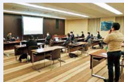
次世代リーダー育成スクールの様子

経営スキルの向上や経営者としての心構えの醸成等を図るプログラムの提供を通じて、将来地域を牽引する企業経営者の育成に取り組んでいます。