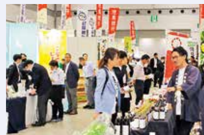
地方銀行フードセレクションの様子

今年度は東京ビッグサイトでの展示商談会を10月に実施し兵庫県内の食品事業者19社が参加しました。