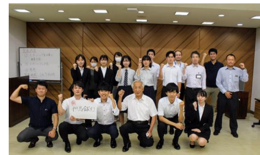
【養父市インターンシップ2021】

Uターン就職の促進ならびに地域企業による人材確保の取組みを支援するため、行政や地域企業と連携して、大学生等を対象としたインターンシップ（就業体験）、企業担当者との意見交換会をそれぞれ実施しました。