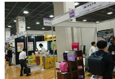
【たんぎん産業メッセ】 (神戸国際展示場)

「たんぎん産業メッセ2021」を「国際フロンティア産業メッセ2021」と同時開催し、「生産性の向上」をテーマに独自の技術力や特徴的なサービスを提供している取引先の販路開拓支援を行いました。