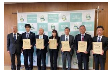
【養父市J-VER合同認証式】

取引先企業に対してカーボン・オフセットによる低炭素に向けた取組みを提案し、J-VERの普及に努めています。