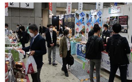
【地方銀行フードセレクション】 (東京ビッグサイト)

兵庫県内の特産品や地域食材の販路拡大を支援するため、地方銀行47行との共催により食品事業者向け商談会「地方銀行フードセレクション2021」を開催しました。