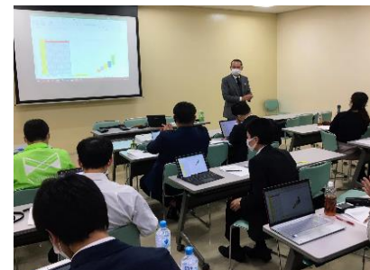
【次世代リーダー育成ブートキャンプ 研修会】

将来の経営者や経営幹部の育成を目指す取組みとして、地域企業合同による研修会「次世代リーダー育成ブートキャンプ」を開催しています。経営スキルの向上や経営者としての心構えの醸成等を図るプログラムの提供を通じて、将来地域を牽引する企業経営者の育成に取り組んでいます。